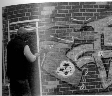
1294 PULIZIA FACCIAE (Harpo)